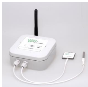
Sensorknoten Typ 2