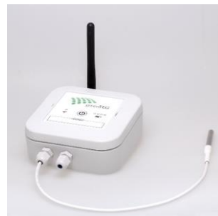
Sensorknoten Typ 3

1x Kombisensor Feuchtigkeit / Umgebungstemperatur